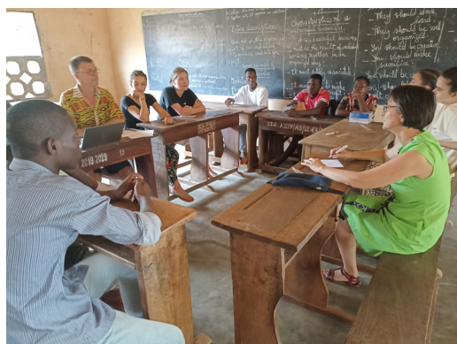
Atelier de sensibilisation à la santé au collège