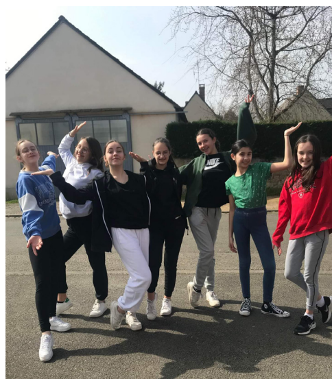
Le groupe de jazz ados d'Héric

Une année 2021-2022 placée sous le signe de la reprise des projets pour l'association.